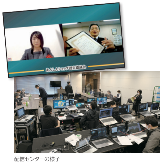
配信センターの様子