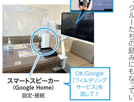
スマートスピーカー (Google Home) 設定・接続